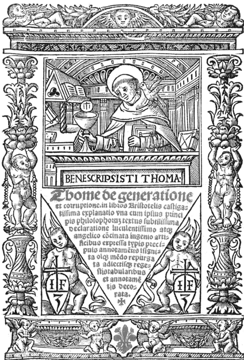
sv. Tomáš Akvinský (* 1224/1225 - 7. marca 1274)